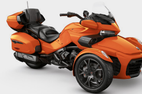
PHOENIX ORANGE METALLIC