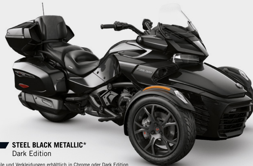
STEEL BLACK METALLIC* Dark Edition

*Teile und Verkleidungen erhältlich in Chrome oder Dark Edition